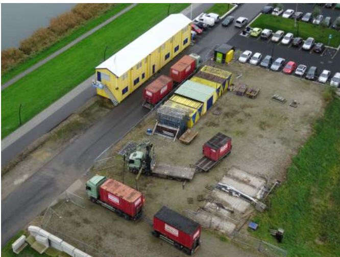
De eerste zes containers zijn inmiddels opgehaald.

Recentelijk is de directie van Vorm over dit onderwerp aangeschreven. Vorm heeft per omgaande gereageerd en inmiddels schriftelijk toegezegd dat alle materialen van de bouwplaats verwijderd zullen worden. Op 12 november 2015 zal het gehele bouwterrein tussen Toren A en De Rokade zijn opgeruimd en al het materieel en opslagmateriaal zal zijn afgevoerd. Zoals u heeft kunnen zien is het werk inmiddels aangevangen.